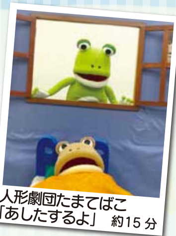
人形劇団たまてばこ 「あしたするよ」 約15分

カエルの青くんとガマガエルのガマくんは、とってもなかよし。 めんどくさくてお部屋の片付けをしたくないガマくんと、早く遊びたい青くんと、そんなふたりのやり取りをお楽しみ下さい。