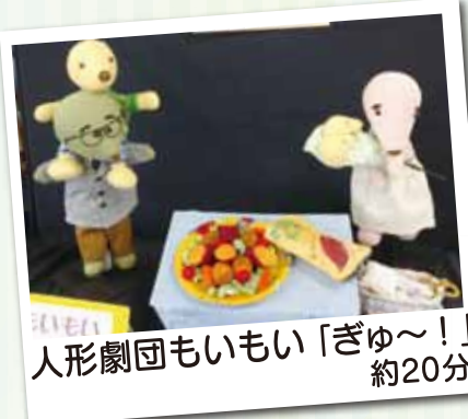
人形劇団もいもい「ぎゅ〜!」 約20分

もぐらの家族のもぐちゃんに兄弟が生まれた。赤ちゃんを受け入れられないもぐ君。もぐ君は、お兄ちゃんになれるかな。