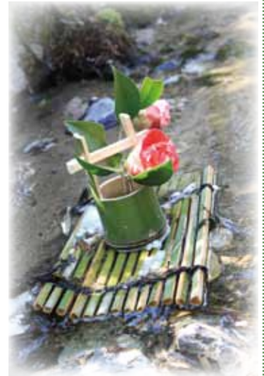
画像はすべてイメージです