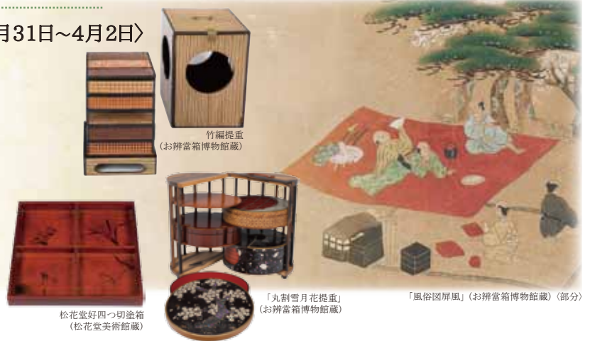
竹編提重 (お辨當箱博物館蔵)