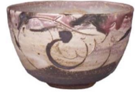
灰釉茶碗 茶道資料館蔵